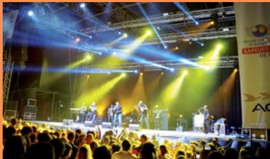
Le samedi soir, Magic System met le feu sur scène pour la clôture du festival.