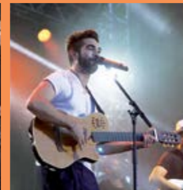
ZAZ, Renan Luce, Bénabar et Kendji Girac ont assuré le show devant des milliers de spectateurs.