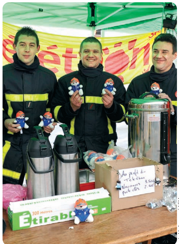
J.-M. Aragon / AFM

Après le Téléthon : remerciements aux bénévoles, communication autour du résultat final de la collecte et remontées d'expérience à la FNSPF.