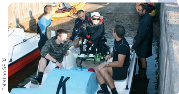
Téléthon SP 33

A pied, à cheval, à vélo... et même sur l'eau ! Les sapeurs-pompiers de Gironde organisent depuis sept ans une édition aquatique du Téléthon, en raft et kayak, depuis les contreforts pyrénéens jusqu'à Bordeaux. Dans les embarcations, une quinzaine de sapeurs-pompiers du centre de secours de Bruges (33), qui emmènent sur les flots impétueux une quarantaine de jeunes handicapés au fil de leurs cinq étapes. En vue de bénéficier de meilleures conditions climatiques, ils ont obtenu une dérogation de l'AFM pour mener leur défi en septembre. « Les antennes locales de l'AFM nous adressent les candidats au raid et nous nous chargeons de leur transport jusqu'au point de mise à l'eau et de leur restauration. Depuis Saint-Étienne-de-Baïgorry dans les Pyrénées-Atlantiques jusqu'à Bruges en Gironde, nous passons par Cambo-les-Bains, Parentis-en-Born (Landes), Lacanau et Pauillac (Gironde). Ces centres de secours nous accueillent toujours de manière très conviviale et participent généreusement à notre collecte de dons », détaille Sébastien Lussagnet, l'un des pompiers organisateurs, qui salue aussi le soutien indéfectible du Sdis 33. Point culminant du périple :