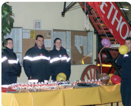
Amicale de Tournon

Cette responsabilisation décuple l'investissement : ainsi, l'an dernier, malgré une plus faible participation due aux intempéries et à la crise économique, le centre de Tournon a réuni ses 2 000 € de dons habituels, les sapeurs-pompiers ayant compensé, spontanément, le manque à gagner.