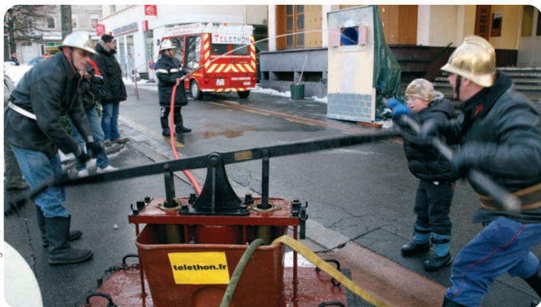
R. Bourguet / AFM

signature d'un contrat d'engagement avec la coordination AFM départementale est indispensable. Il est d'ailleurs conseillé de confier cette démarche au correspondant départemental Téléthon sapeur-pompier, très au fait des procédures.