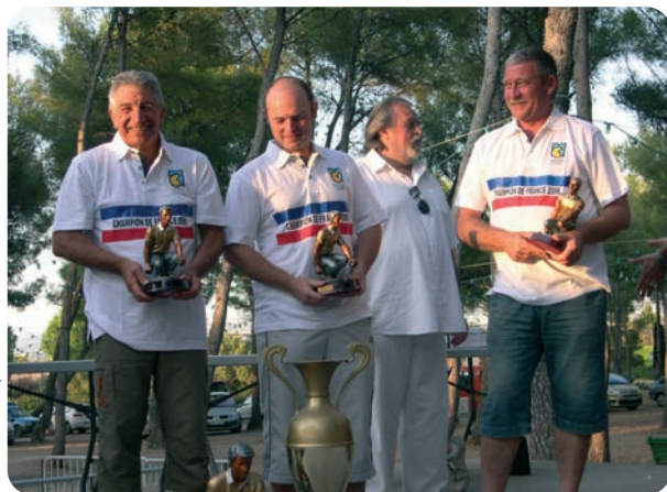
Asso. Pétanque SP

Saviez-vous que la pétanque est pratiquée de fort longue date chez les sapeurs-pompiers ? Les premiers tournois départementaux remontent aux années 1960. Et cet engouement ne faiblit pas : les 2 et 3 septembre 2011, ils seront 768 participants, par équipes de trois, à rivaliser d'adresse et de ruse pour s'approcher au plus près du cochonnet, au championnat