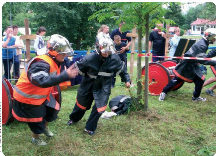
Amicale de Drusenheim