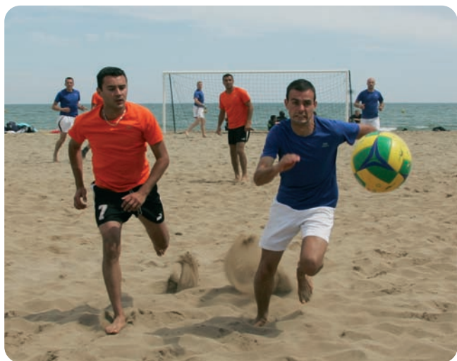
Un casque, un ballon et du cœur