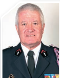
Forgé / Gautier

Contribuer à aider des jeunes à trouver leur voie, offrir un encadrement rigoureux qui favorise leur épanouissement, travailler en alliance éducative avec les parents, voire avec les professeurs, en les motivant pour leurs études. Avec, à la clef, les sourires ravis des jeunes et de leurs familles, lors de la remise de diplôme