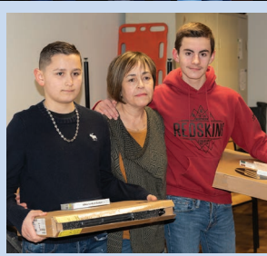
UDSP* Val d'Oise