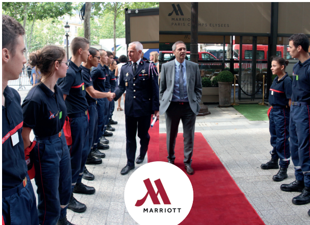
MERCI À LA GÉNÉROSITÉ DE NOS DONATEURS ET À LA SOLIDARITÉ DE NOS SAPEURS-POMPIERS POUR LE FINANCEMENT DE CES PRIMES !

En 2020, la crise sanitaire avait empêché la tenue de notre traditionnelle cérémonie des primes d'installation. Un événement hautement symbolique pour ces orphelins dont le parent sapeur-pompier est décédé en service commandé. Ils ont désormais 24 ans ou plus, ont fini leurs études. Si l'ODP peut toujours leur apporter un soutien (création d'entreprise, etc.), cela signifie surtout la fin de la prise en charge trimestrielle.