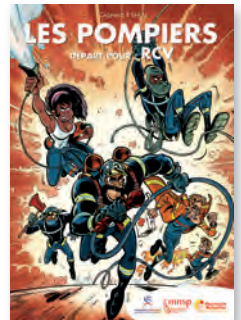
Pompiers départ pour RCV

La MNSP a également dévoilé au congrès la Bande Dessinée : Les Pompiers, départ pour : RCV, un support ludique destiné à la prévention des risques cardio-vasculaires.