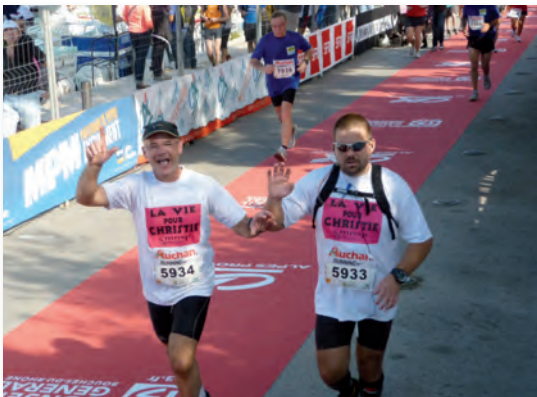
La délégation de soutien à l'Association "La Vie pour Christie" au marathon Marseille-Cassis.