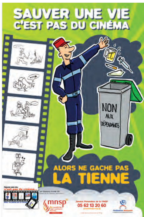
Affiche adaptée de la section gagnante des JSP de Cherbourg-Octeville

Sur le volet social, la MNSP a participé à la préparation de la loi pour l'amélioration du statut des