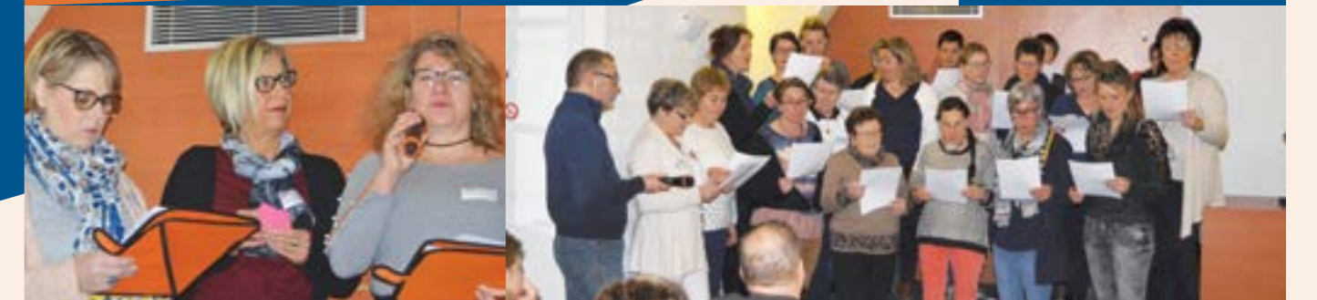
Moments d'échanges et de partage afin de faire le bilan de la journée précédente.