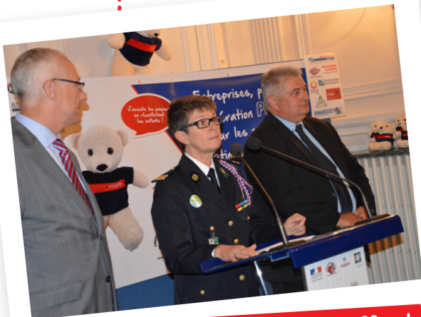
10/2016. Lancement officiel à la préfecture du Gers