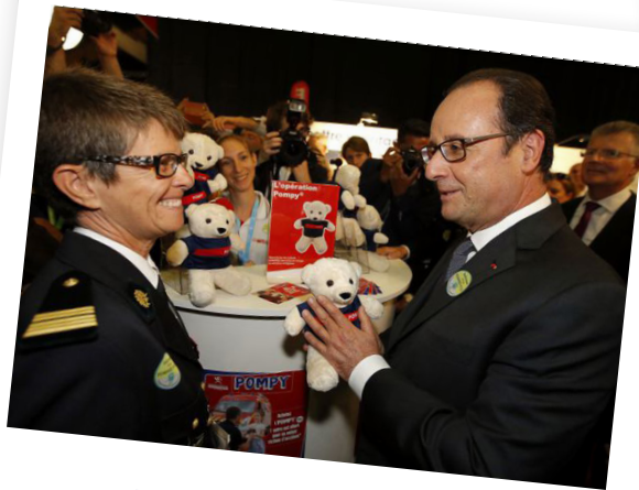
09/2016. Congrès national à Tours