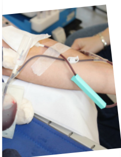
et les gestes qui sauvent Cent Français du Sang