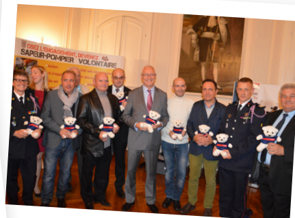
En présence des entreprises partenaires de l'opération