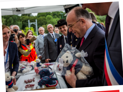
07/2016. RTN Verdun