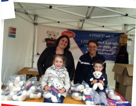
09/2016. Portes-ouvertes dans le Haut-Rhin