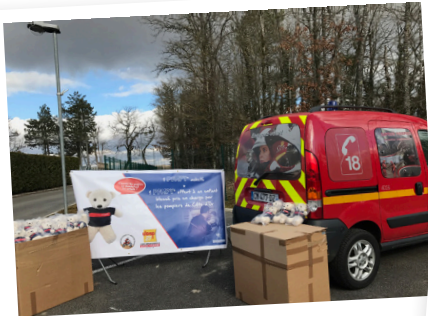
02/2017. Distribution en Côte d'Or grâce à l'association Moto Cross Crampons 112