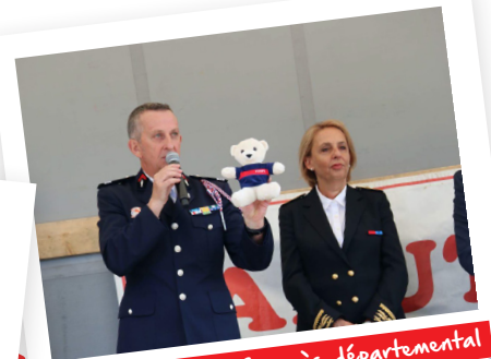
09/2016. Congrès départemental du Cher