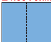
DOUBLE PAGE 420 x 297 mm + 5 mm de fond perdu (430 x 307 mm)