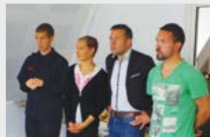
Les vaillants coureurs du marathon !