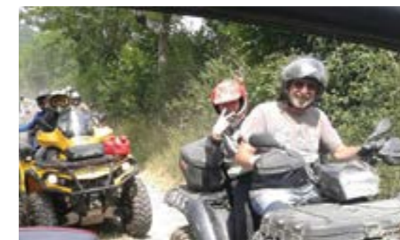
Sortie quad pour les plus téméraires.