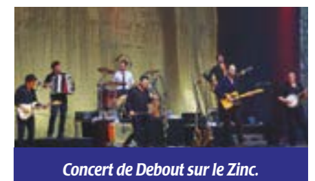
Concert de Debout sur le Zinc.