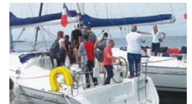
Certains ont pu jouer aux aventuriers en mer !