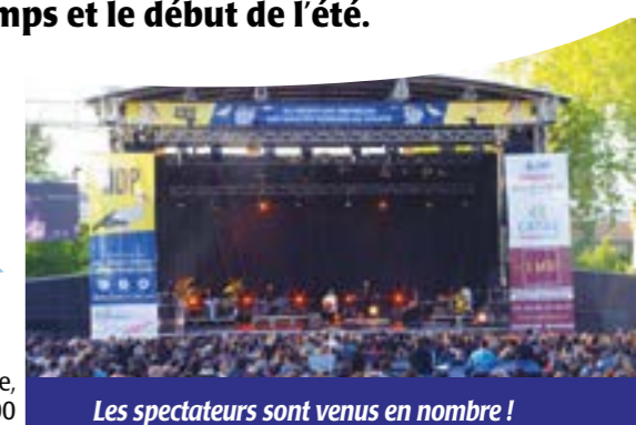
Les spectateurs sont venus en nombre!

Le mois de mai a célébré le retour du Festival ODP. Organisé par l'Union départementale de la Gironde, cette seconde édition a rassemblé près de 12 000 spectateurs, du 13 au 15 mai 2016, à Talence.