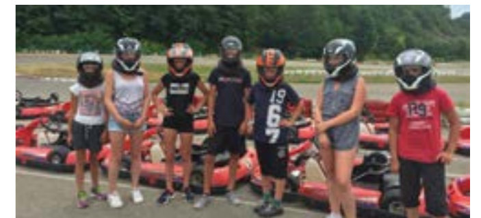
Nos Pupilles, champions de karting !

Cette année encore, les Pupilles ont pu profiter des joies de l'été à travers des séjours divers et variés. Les vacances les ont menés à travers toute la France. Ainsi, il y en a eu pour tous les âges et tous les goûts ! Entre activités sportives et découvertes culturelles, chacun a pu savourer cette escapade loin du quotidien. Et si certains sont partis plusieurs jours voire semaines, d'autres ont vécu une journée exceptionnelle, le 14 juillet. En effet, 9 de nos Pupilles ont pu assister au traditionnel défilé et profiter du fabuleux spectacle depuis les tribunes officielles !