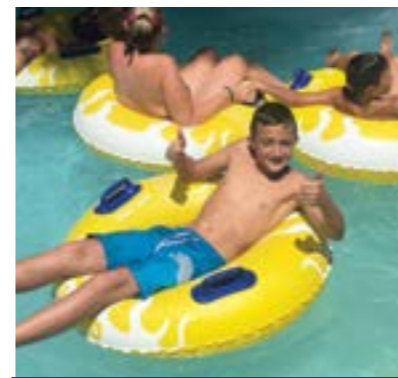
Les enfants ont pu goûter aux joies de l'eau !