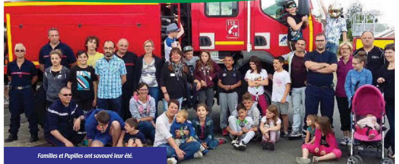
Familles et Pupilles ont savouré leur été.