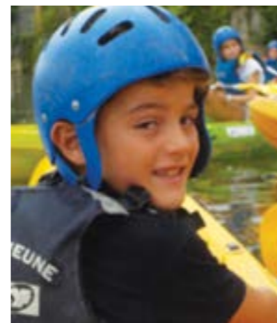
Canoë et aventures étaient au programme !

Cette année encore, les Pupilles ont pu profiter des joies de l'été à travers des séjours divers et variés. Les vacances les ont menés à travers toute la France. Ainsi, il y en a eu pour tous les âges et tous les goûts ! Entre activités sportives et découvertes culturelles, chacun a pu savourer cette escapade loin du quotidien. Et si certains sont partis plusieurs jours voire semaines, d'autres ont vécu une journée exceptionnelle, le 14 juillet. En effet, 9 de nos Pupilles ont pu assister au traditionnel défilé et profiter du fabuleux spectacle depuis les tribunes officielles !