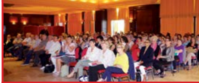
Synthèse des ateliers