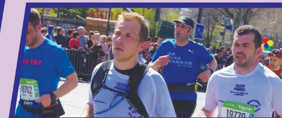
Les administrateurs et quelques coureurs