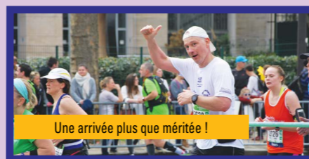
Une arrivée plus que méritée !