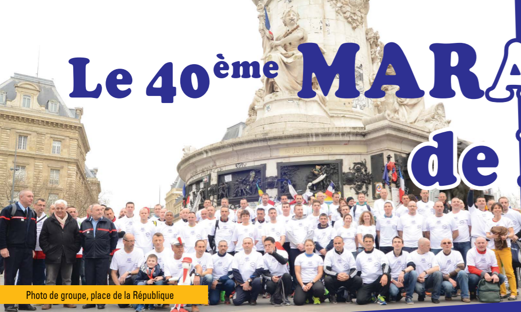
Photo de groupe, place de la République