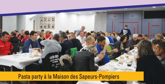
Pasta party à la Maison des Sapeurs-Pompiers