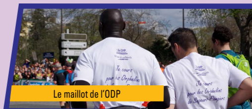
Le maillot de l'ODP