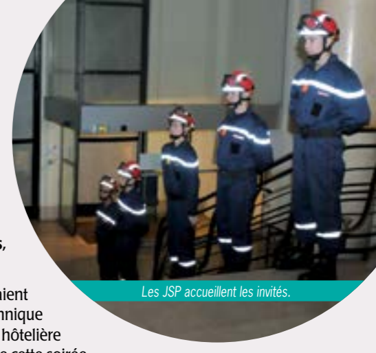
Les JSP accueillent les invités.

Depuis plusieurs années, le Rotary Club Paris Sud Est, à travers différentes manifestations, soutient l'Œuvre des Pupilles.