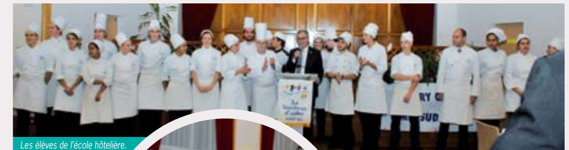
Les élèves de l'école hôtelière.