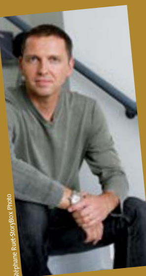
Stéphane Ruef - Storybox Photo