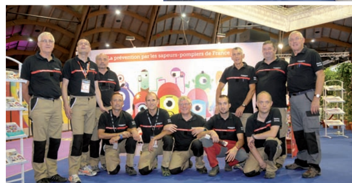
L'équipe de monteurs du stand : un groupe fidèle pendant le congrès national, mais surtout avant et après, pour permettre à la FNSPF, à l'Œuvre des pupilles et à la Mutuelle d'aller au devant de leurs adhérents.