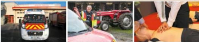
MAGAZINE DE LA FEDERATION NATIONALE SAPEURS-POMPIERS DE FRANCE AVEC LE MAGAZINE LUMIERE - 4,48 €