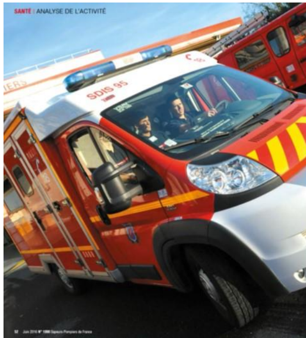
SANTÉ / ANALYSE DE L'ACTIVITÉ