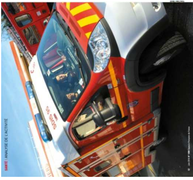
SANTÉ - ANALYSE DE L'ACTIVITÉ